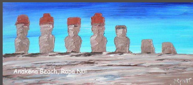
Anakena Beach, Rapa Nui