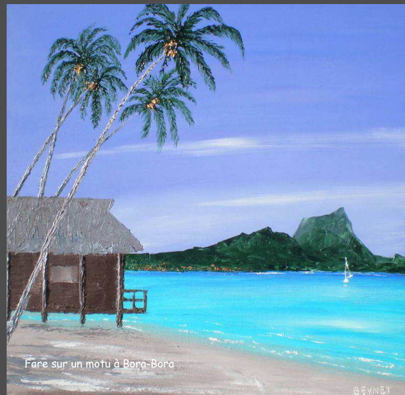
Fare sur un motu à Bora-Bora