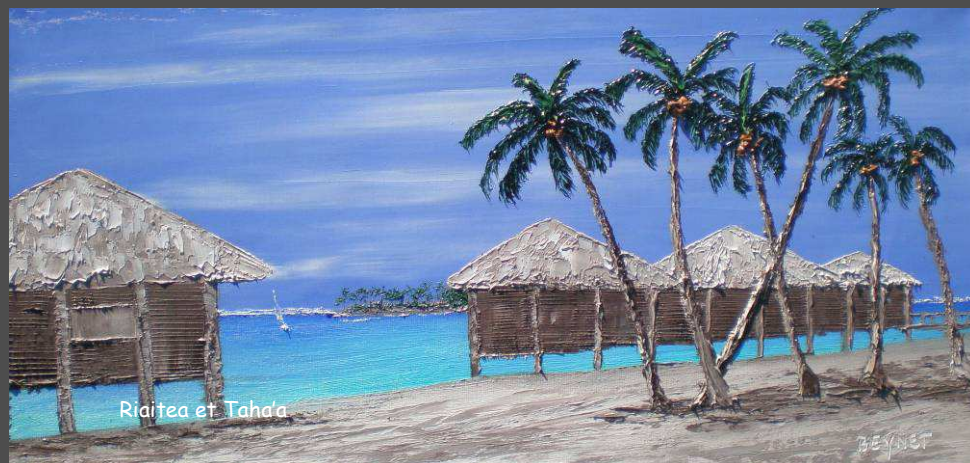
Raiatea et Taha'a